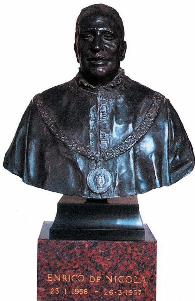
Busto bronzo di Enrico De Nicola primo Presidente della Corte Costituzionale già primo Presidente della Repubblica.