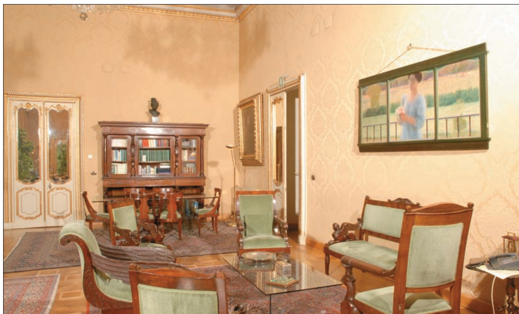
Una veduta dello studio del presidente con il celebre dipinto di Giacomo Balla, Il Maggio .