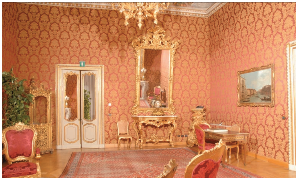
Il Salotto rosso con una veduta del Canal Grande (opera della scuola del Canaletto).