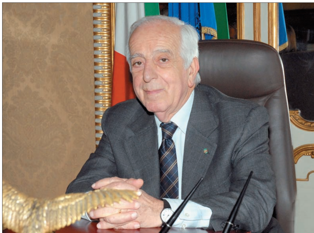
Francesco Amirante, Presidente della Corte costituzionale.