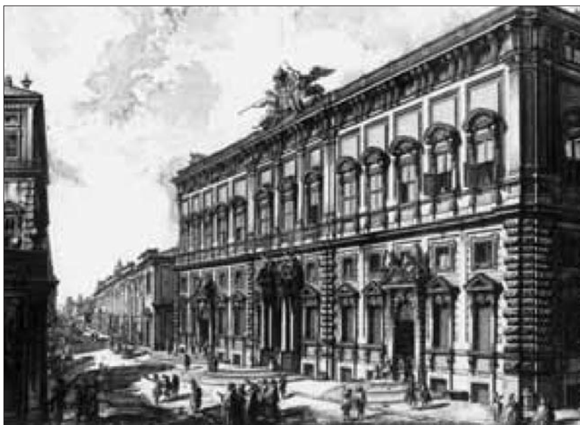
Il Palazzo della Consulta in una celebre incisione di Giovanni Battista Piranesi.

La Corte non è una terza istanza legislativa, a cui si possa fare ricorso per contestare o modificare, con una valutazione politica di opportunità, le scelte fatte dai rappresentanti eletti in Parlamento. Essa sta a guardia dei "confini". Se il legislatore resta entro i confini della Costituzione (e i principi costituzionali lasciano grande spazio per le scelte del legislatore), la Corte non ha alcun potere di censurarne le valutazioni, anche se magari le appaiano inadeguate o difettose. Se però il legislatore supera tali confini, spetta alla Corte censurare la legge o ricondurla entro di essi, per impedire che la Costituzione venga violata.