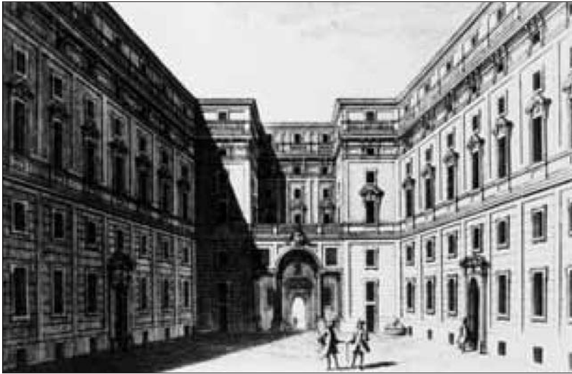
Il Cortile d'onore del Palazzo della Consulta in una stampa di Bernardo Sansone Sgrilli.

Ogni giudice, entrando a far parte della Corte, si immette nel “collegio” apportando il contributo della sua personalità e lavorando a stretto contatto con gli altri giudici. È infatti una caratteristica essenziale della Corte costituzionale quella di essere un organo “collegiale”: le sue decisioni non sono prese da una né da poche persone, ma sempre dal collegio, cioè dall’insieme dei giudici (da undici - numero minimo richiesto perché la Corte possa deliberare - a quindici, il totale dei membri).